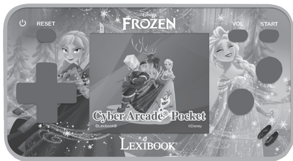
JL1895FZ Manual de utilizare